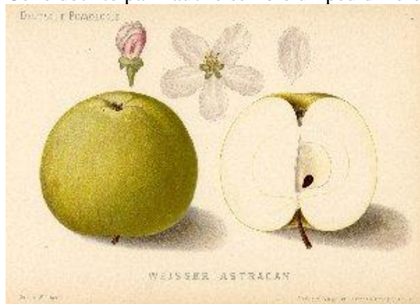
W.Lauche, Deutsche Pomologie, 1882/83.

Celle décrite par Lauche semble un peu différente, loges ne paraissent pas feutrées :